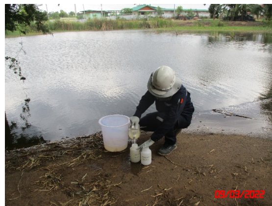
สระน้ำทางด้านทิศตะวันตก