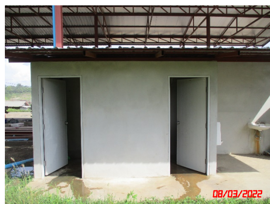
ห้องสุขา