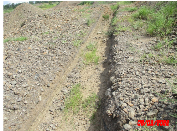
คูระบายน้ำ