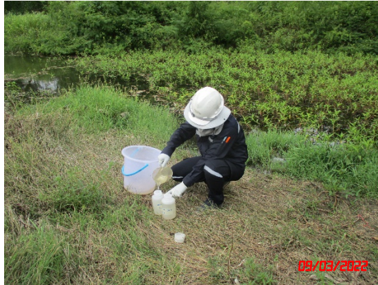
ห้วยจอมทอง