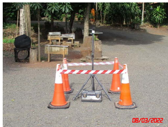
สำนักสงฆ์เขาแก้ว