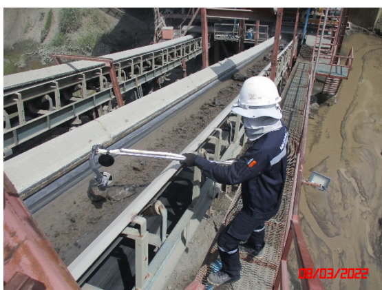
สายพานลำเลียง