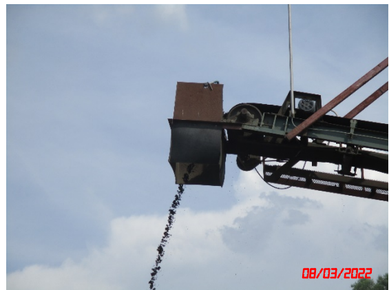
ถังครอบปลายสายพานลำเลียง