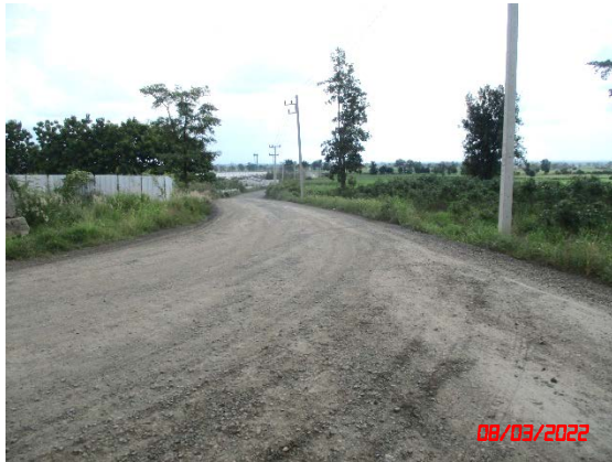
รูปที่ 2-10 เส้นทางขนส่งแร่