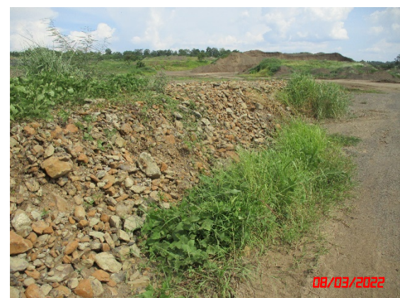
คันทำนบดิน