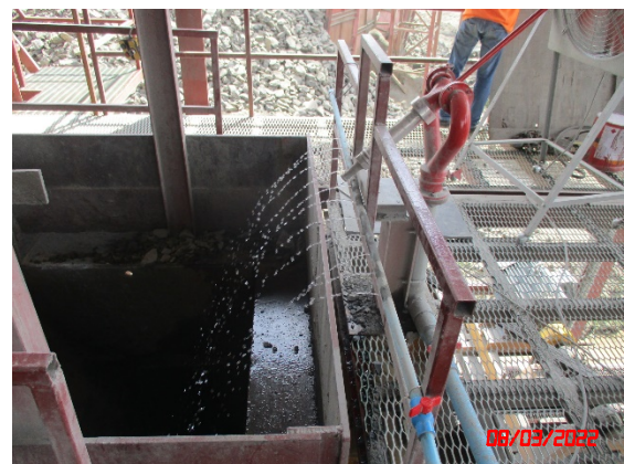
ระบบสเปรย์น้ำบริเวณปากโม