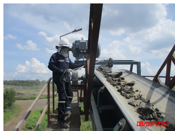
ปลายสายพานลำเลียง