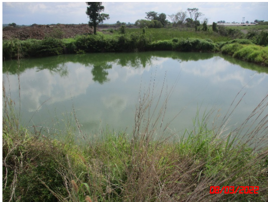
ทางด้านทิศตะวันตกของพื้นที่โครงการ