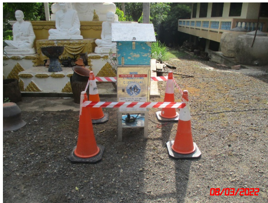
สำนักสงฆ์เขาแก้ว