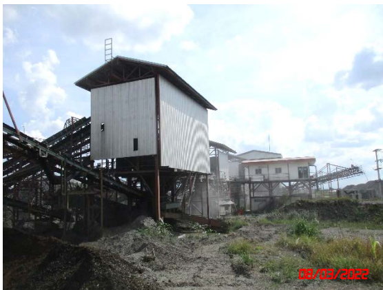
อาคารปิดคลุมปากโมที่ 2