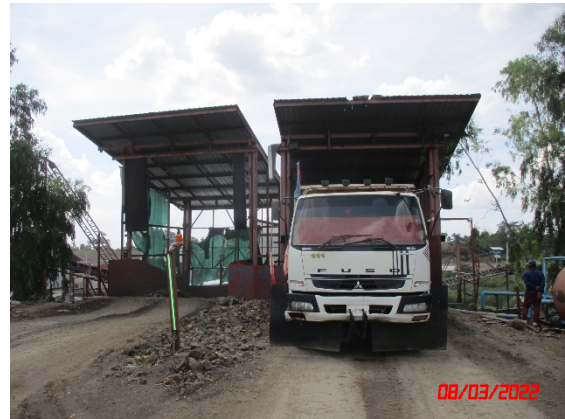
อาคารปิดคลุมยังรับหินใหญ่