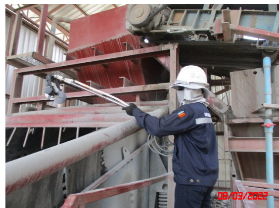
ตะแกรงคัดขนาด