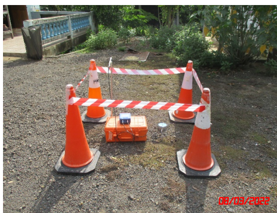
สำนักสงฆ์เขาแก้ว