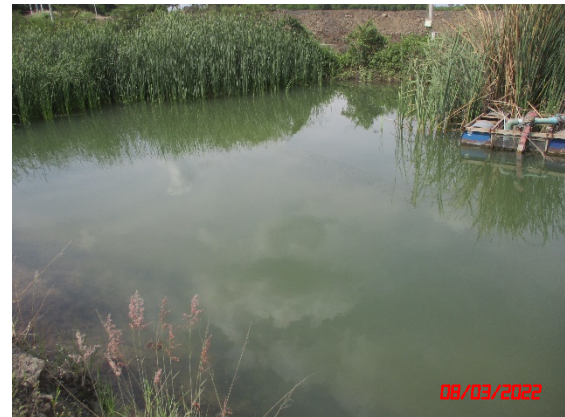
ทางด้านทิศตะวันตกของพื้นที่โรงโม่หิน