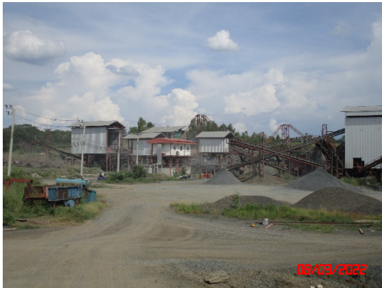
อาคารปิดคลุมโรงโม่หิน