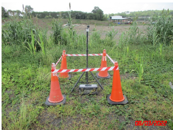
สำนักงานโรงโม่หินของโครงการ