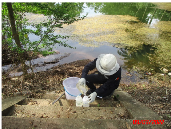
สระน้ำทางด้านทิศตะวันออกเฉียงเหนือ